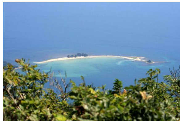
蝾螺ヶ岳から水島を展望

Japan TOPO 10M Plus v1.01 Garmin Corporation 1995-2010 Shobunsha Publications, Inc. 2010