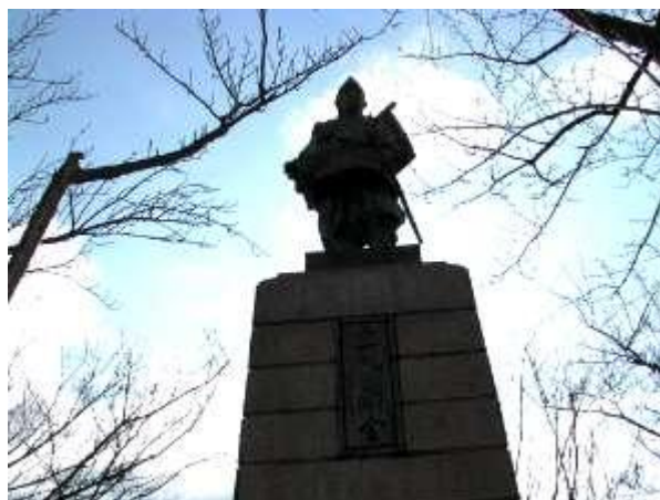
飯盛山山頂の楠木正行像