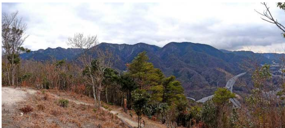
六甲連山・落葉山・灰方山・湯槽谷山・高尾山・逢ヶ山・・・高丸山山頂より