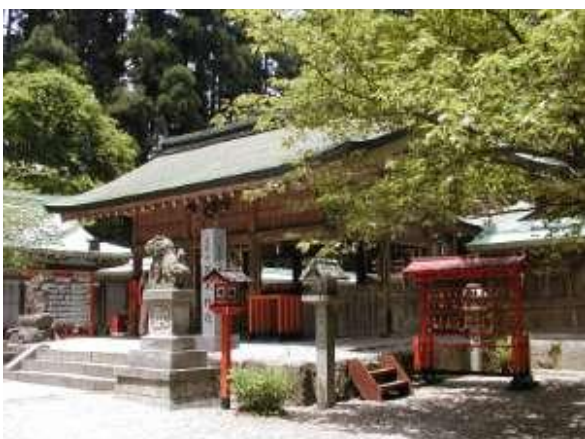
金剛山 葛木岳(葛木神社)