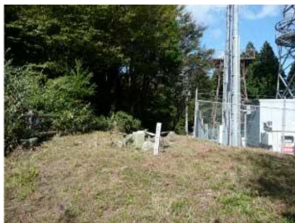
湧出岳(一等三角点峰)