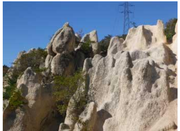
ロックガーデン ピラーロック