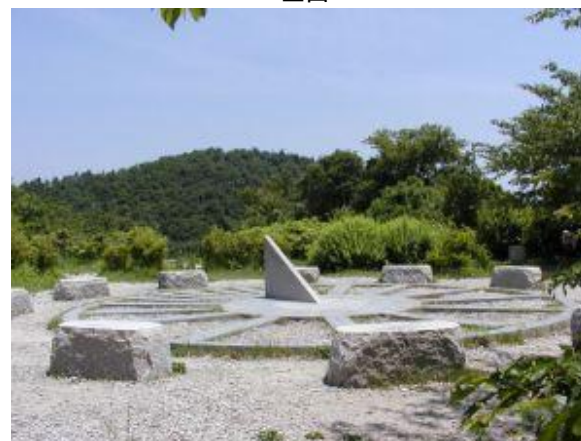
二上山 山頂の日時計