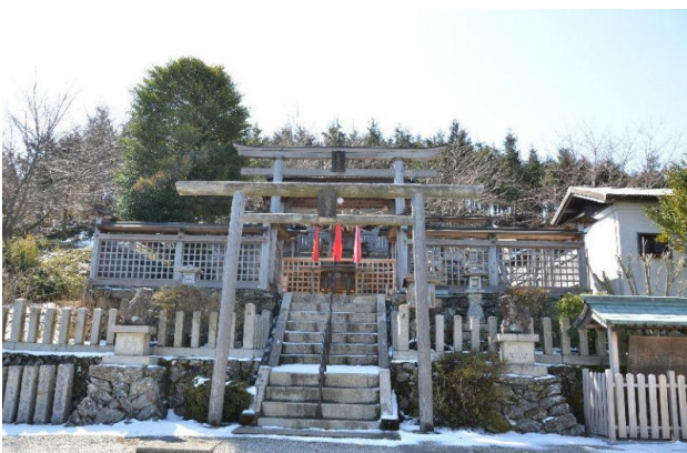
国城山山頂の国城神社 H10年台風7号で山頂の木は倒されたそうだ。