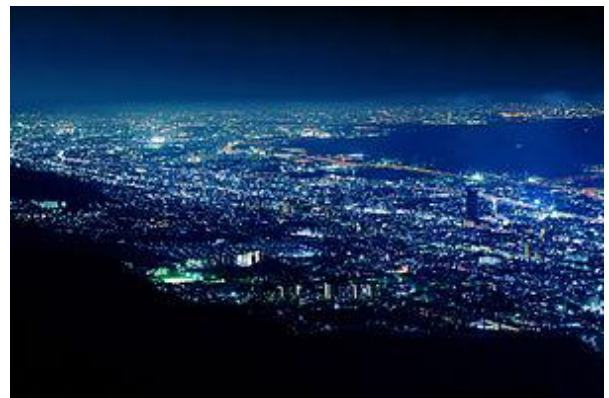
掬星台の1000万ドル夜景