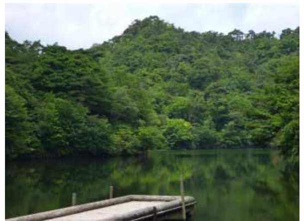
穂高湖とシエール槍