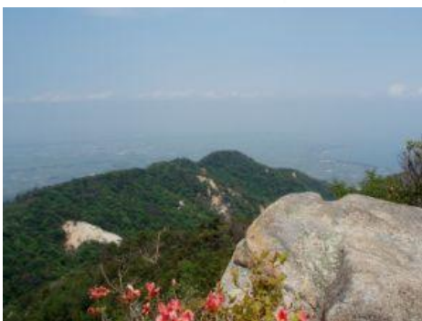
岳山 オオム岩より