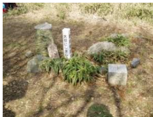
地蔵山 一等三角点