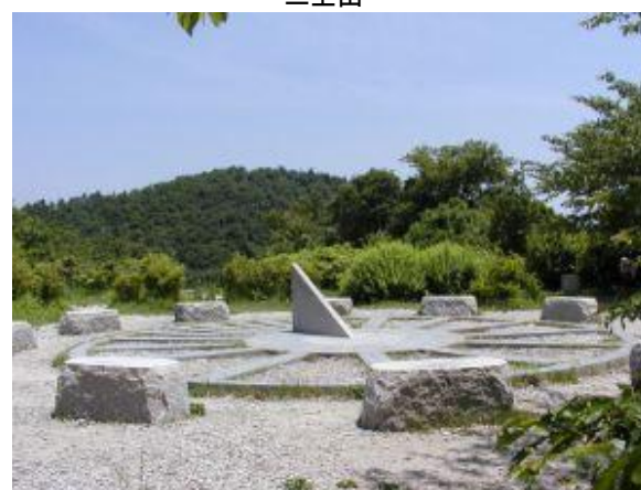
二上山 山頂の日時計