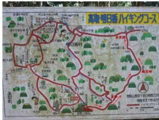
高取明日香ハイキングコース