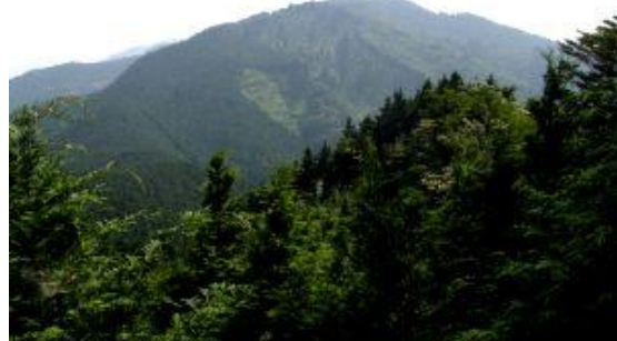
水井山 小野山から