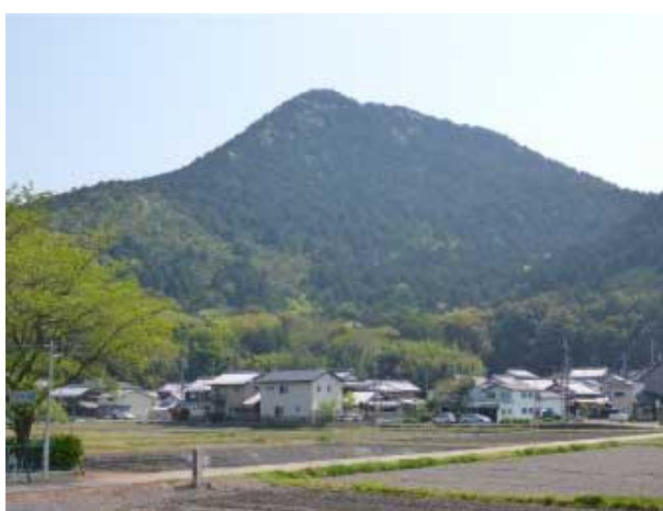
三上山 御上神社より