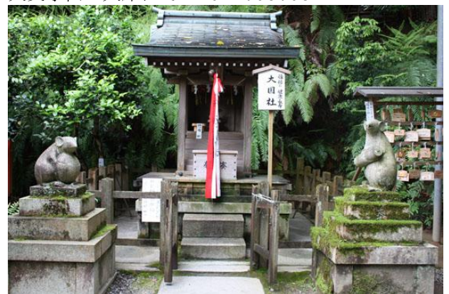
大豊神社 大国社 大国主命を祀る