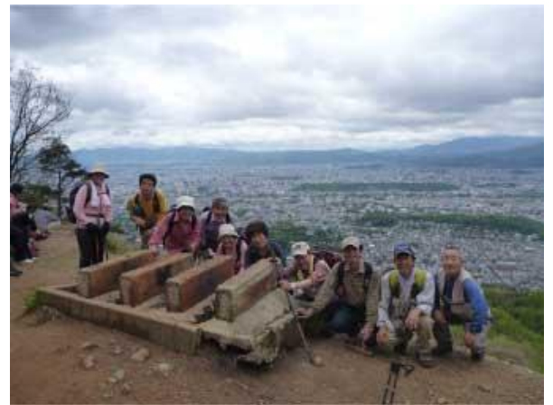
大文字山 火床にて 2012.05.03