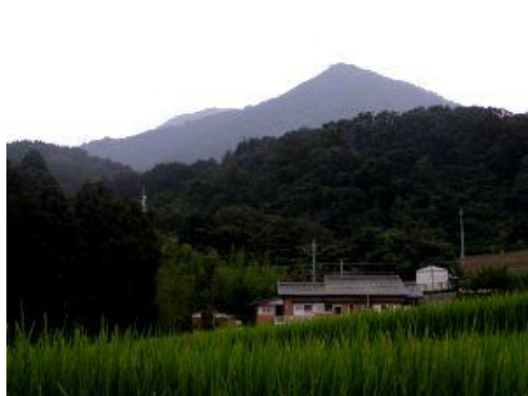
野坂岳 粟野駅付近から