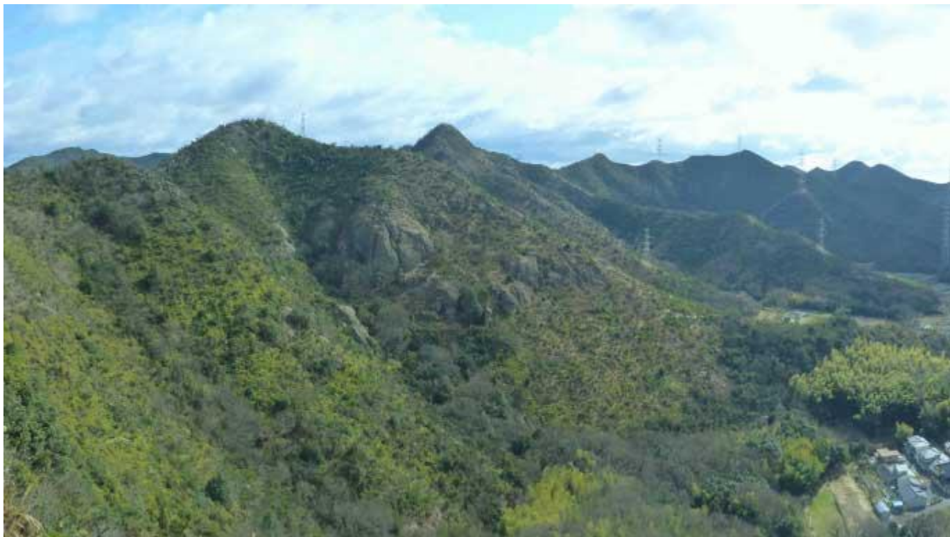
播磨アルプス 桶居山