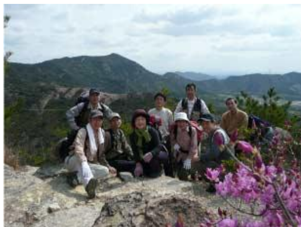
百間岩を登りきって一息（後方は高御位山）