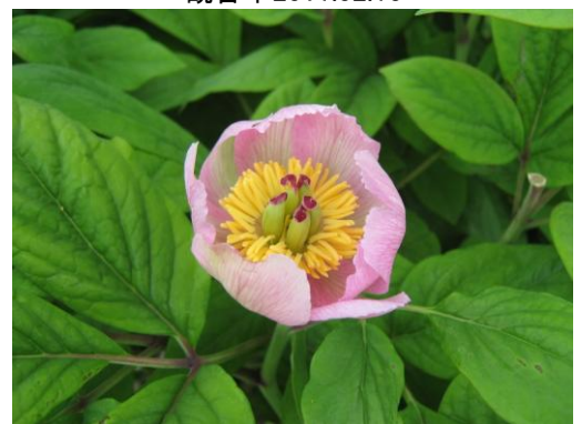
参考:ベニバナヤマシャクヤク(6月)