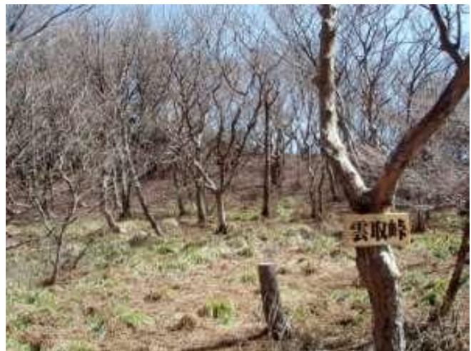
雲取峠 リョウブが群生