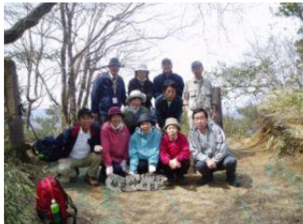
ダイヤモンドポイント