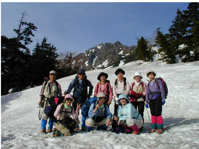
西穂高岳をバックに 2002/05/03