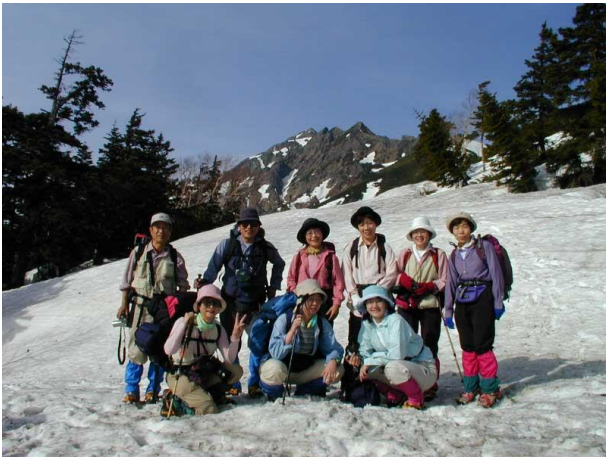
西穂高岳をバックに 2002/05/03