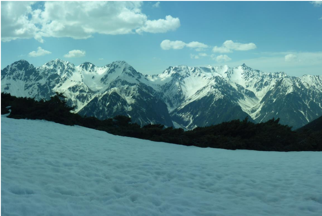
蝶ヶ岳からの大パノラマ 穂高連峰・槍ヶ岳