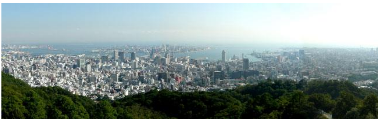
ビーナスブリッジより神戸の展望