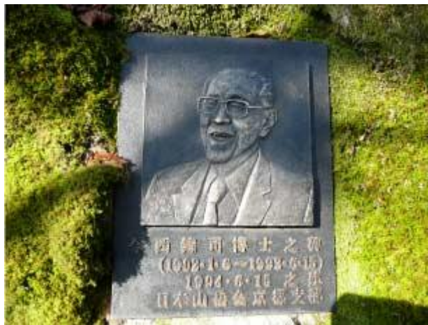
今西錦司レリーフ