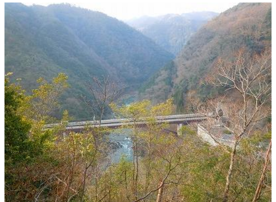
ツツジ尾根から望む保津峡駅