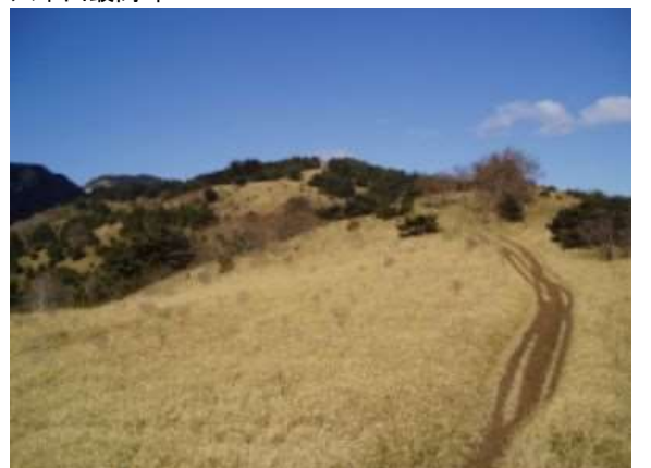
東お多福山 697m ☆東お多福山登山口 460m